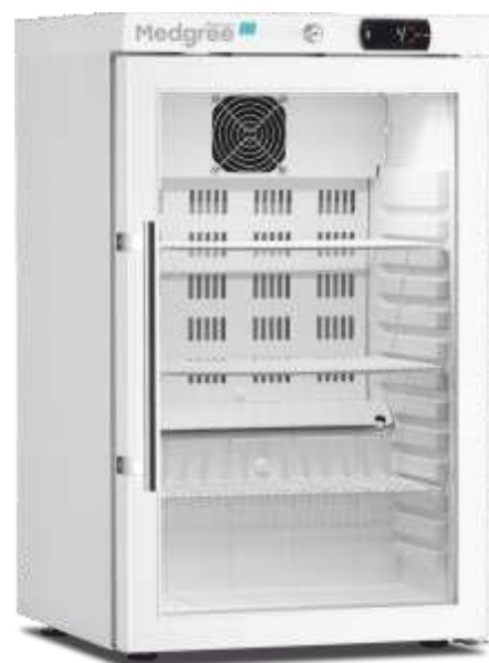
MLRE 66 G