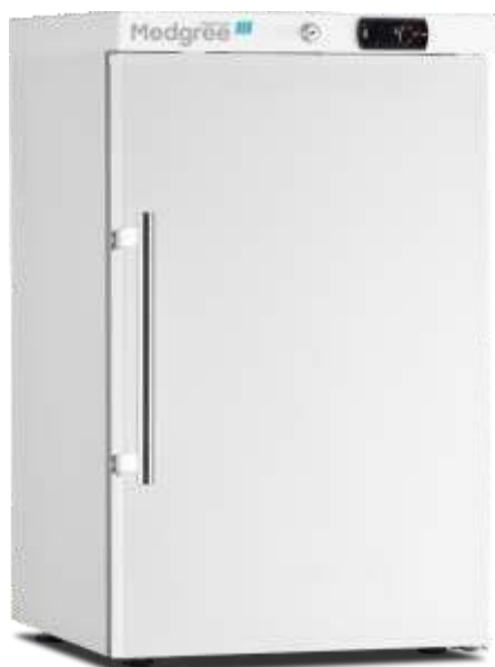
MLRE 66 S